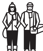
Внутрішньо переміщені особи

Одночасно такі особи повинні відповідати одній з наступних вимог: