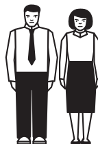
Чоловіки/жінки 20-60 років

Категорії осіб, які підлягають призову під час мобілізації можуть визначатися указом Президента України.