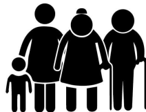
Члени сімей загиблих учасників АТО